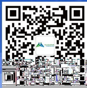
微信公众号二维码